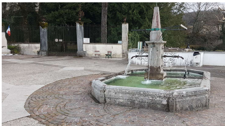
Fontaine de la place

Ces deux fontaines posaient un problème aux Dortanais depuis plusieurs années, particulièrement aux riverains qui ne voyaient plus couler d'eau. Les possibles coupables ? Un réseau bouché pour l'une, des constructions avoisinantes qui auraient pu endommager le réseau pour l'autre... Plusieurs interventions techniques avaient mené le conseil à envisager la réfection d'un nouveau réseau, pour les deux fontaines. Que demander de mieux à une fontaine si ce n'est de nous fournir de l'eau ? L'essai de la dernière chance par les services techniques pour les deux fontaines a finalement porté ses fruits : le 16 mars pour la fontaine de la place du Château, et le 31 mars pour la fontaine de Maissiat d'En Bas. Alors qu'une demande de subvention avait été déposée à la mi-mars à la région AuRA dans le cadre du Bonus Relance (aide financière accordée aux communes de moins de 20 000 habitants, pouvant atteindre 50%), la remise en eau de ces deux fontaines évitera bien des frais. Certains travaux resteront tout de même d'actualité. En effet, l'étanchéité et la restauration de la pierre seront des postes maintenus sur l'enveloppe demandée.