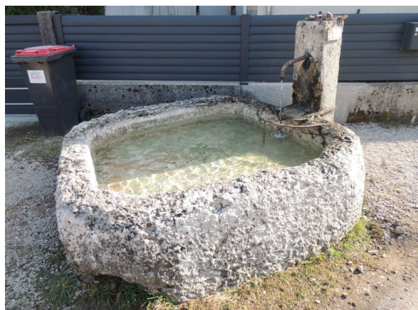
Fontaine de Maissiat d'En Bas