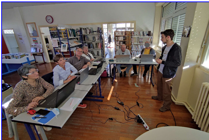
HBA met à disposition des PC pour ceux qui n'en ont pas.

Cette quatrième séance avait également pour objectif de scanner un document avec son smartphone et de